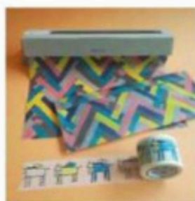
7 Charlotte Hugnet