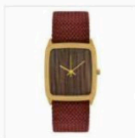
4 Amu Mame Stouillet