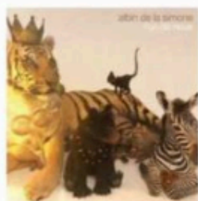
6 Véronique Vatinos