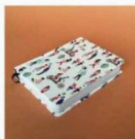
2 Honore Bonon