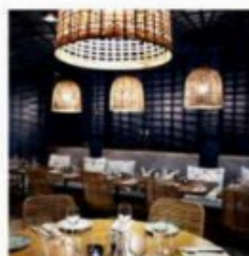
8 Constance Bonquô